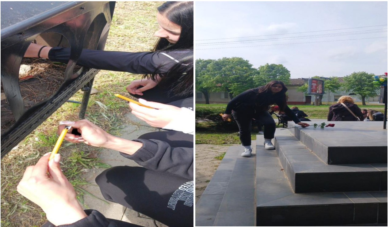
Споменици сећања на невинне жртве.

https://www.facebook.com/reel/819774780211144